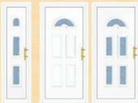
D-01 D-02 D-03